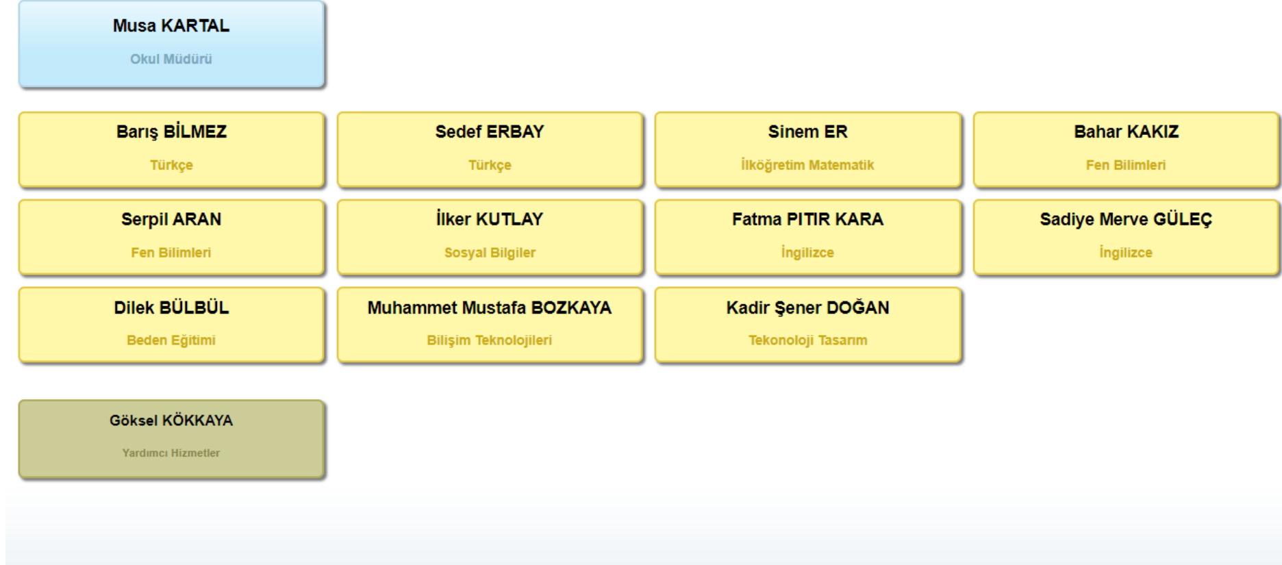
Şekil 1: Organizasyon Şeması